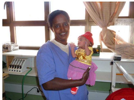
zurück in „unserer“ NICU