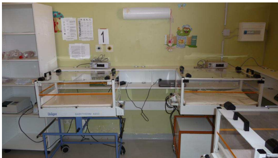
Patientenzimmer der NICU

In diesem Einsatz konnten die handwerklichen Arbeiten in NICU, PICU und medizinischem Lager weitgehend abgeschlossen werden.