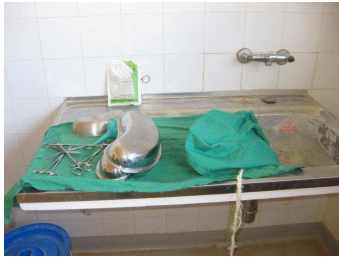
Waschbecken im Geburtsraum

Nach einer ersten Bestandsaufnahme wollen wir im nächsten Einsatz neben der Schulungsarbeit und weiteren kleinen Maßnahmen Regale und Nachtschränkchen mitnehmen, die Waschbecken zumindest in den beiden Geburtsräumen reparieren und einen Geburtsraum so an die Solaranlage anschließen, dass bei Stromausfall Licht, Erstversorgungswärmebett und Absaugpumpe sowie ein weiterer Verbraucher versorgt werden.