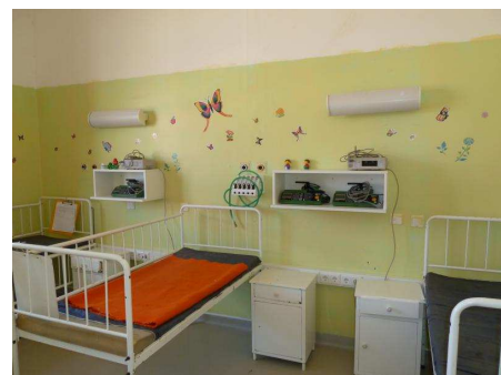
Patientenzimmer der PICU

Auch der Lagerraum konnte mit zusätzlichen Steckdosen und einem zusätzlichen Regal für die medizinischen Kleingeräte vervollständigt werden.