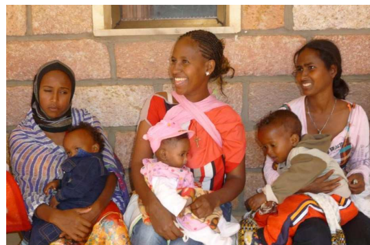
unsere ehemaligen NICU - Patienten zu Besuch